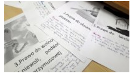
Prawa człowieka - informacje przygotowane przez uczennice