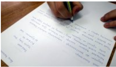
Pisanie listów w "Rymoncie"