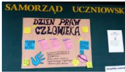
Plakat przygotowany przez uczniów z Kurzeszyna