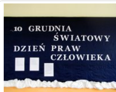
Gazetka przygotowana przez uczniów z Lubani