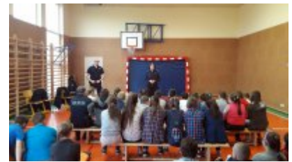
Spotkanie z uczniami z Konopnicy