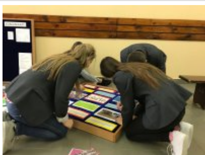
Uczniowie "katolika" przygotowujący gazetkę ścienną

Dziękujemy za włączenie się w akcję i przesłanie informacji. Mamy nadzieję, że w przyszłym roku do obchodów Światowego Dnia Praw Człowieka przyłączy się jeszcze więcej szkół w naszym powiecie.