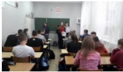
Pisanie listów w "Rymoncie"