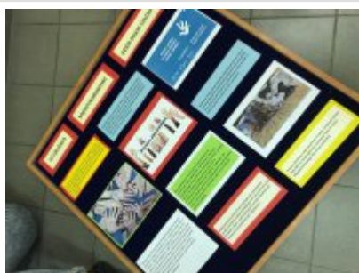
Gazetka przygotowana przez uczniów